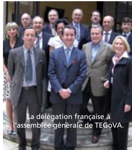
La délégation française à l'assemblée générale de TEGoVA.

TEGoVA a tenu son assemblée générale à Paris les 11 et 12 juin 2010 au Conseil supérieur du notariat (CSN). Les points marquants de cette assemblée ont été l'adhésion de la Confédération des experts fonciers (CEF) à TEGoVA et le fait que le CSN ait obtenu l'accréditation pour certifier des experts REV.